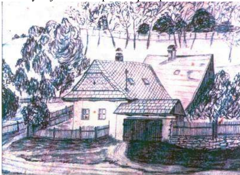
Kresba Adolfa Vancla z r. 1937, dům č. 144

bylo jedno z pohádkových zastavení u ježibaby při akci Kulturní a památkové komise a Sdružení dobrovolných hasičů pro děti. Návštěvníci, kteří jsou stále srdečně zváni, zde mohou, krom jiného, zhlédnout i znovu odkrytý a opravený záklopový strop nebo řadu fotografií z průběhu oprav i fotografií od pana Gilky, na kterých je domek v podobě před přestavbami.*