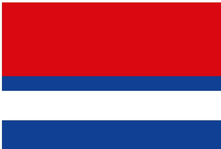
Obr. 2 - Vlajka města Březová nad Svitavou